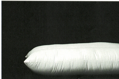
マイクロシルスター